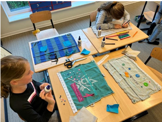
De schorten in wording.