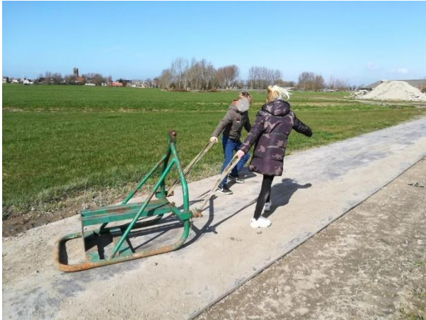
Laten zien hoe sterk jij bent