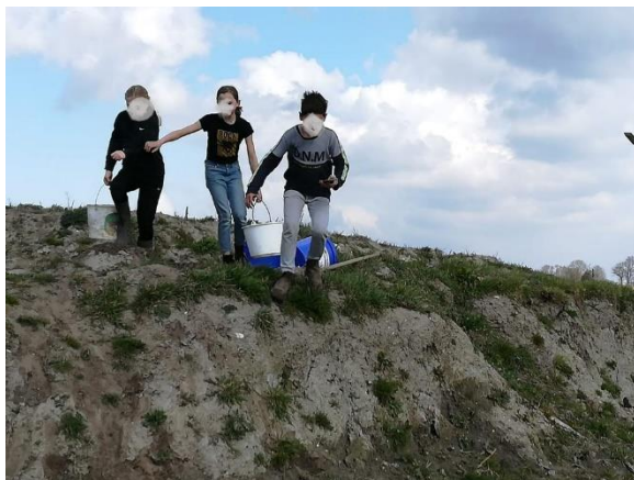
Sjouwen met zand op de stormbaan