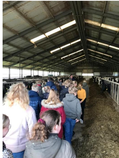
Rondleiding door de stallen