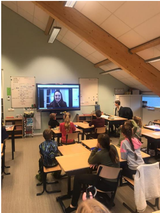
Online gastles in groep 5/6