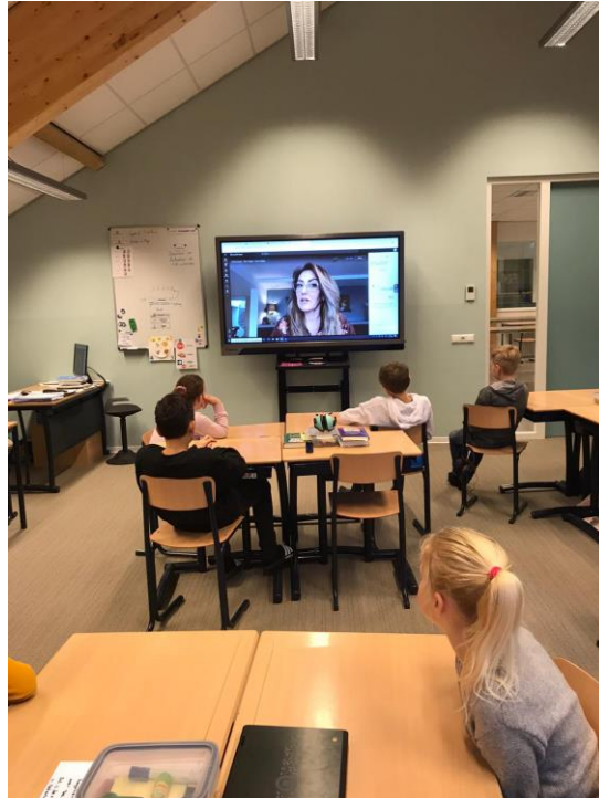
Online gastles in groep 7/8