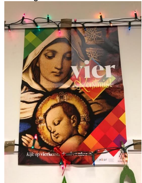
Kerstposter in groep 5/6

Ik wens jullie een heel goed kerstfeest. Dat de geboorte van Jezus ons blij mag maken.